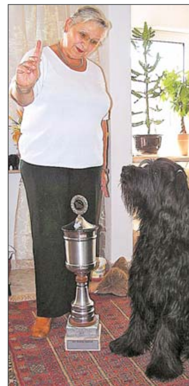
AUFGEPASST! Auch der, laut Pokalinschrift, schönste Briard Deutschlands muss aufs Wort hören.

vom Briard-Club Deutschland zur „Besten Hündin des Jahres“ gekürt worden, hatte sich zuvor auch schon als „Nachwuchshündin“ diesen Titel gesichert. Die vierjährige schwarzhaarige Schönheit darf in Deutschland, Belgien und Frankreich in der Zucht eingesetzt werden. In ihrem Stammbaum finden sich ebenfalls mehrere „Beste Hündinnen“.