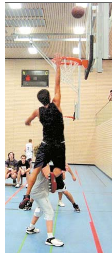
SPAß AM SPIEL UND AM KONTAKT zu anderen hatten die Jugendlichen beim Basketballturnier.